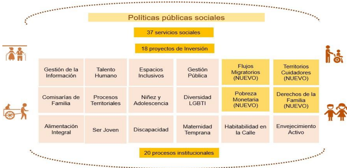
Figura 3. Relaciones en el flujo de la planeación de la SDIS