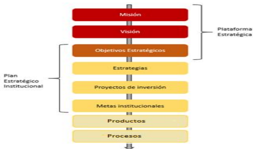
Figura 2. Articulación del ámbito de planeación estratégica